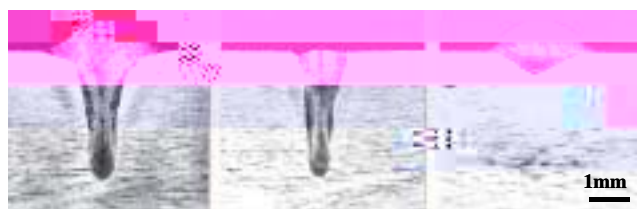
(a) Hybrid welding (b) Laser welding (c) Arc welding

Photo 1 にハイブリッド溶接法の断面形状を示す。レーザー単独，アーク単独のビード断面形状も比較のため併せて示す。ハイブリッド溶接法の溶け込み形状は，レーザー単独とアーク単独を合わせた形状になっている。表面近くはアークの熱で溶融され，ワイヤが供給されるため余盛りができています。ハイブリッド溶接法の溶け込み深さはレーザー溶接法とほとんど同じである。これはレーザーによって溶け込み深さが決定され，アークを複合化して入熱を増やしても，アーク熱は表面近くを溶融させるのに消費されるだけで，溶け込み深さを増加させることはできないことを示している。ただし，ハイブリッド溶接法ではレーザー単独より溶融金属が多い点は後述する重ね溶接における隙間許容度やビード幅に有利に働く。