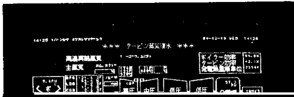
Table 1 Function of fuel and steam optimum system